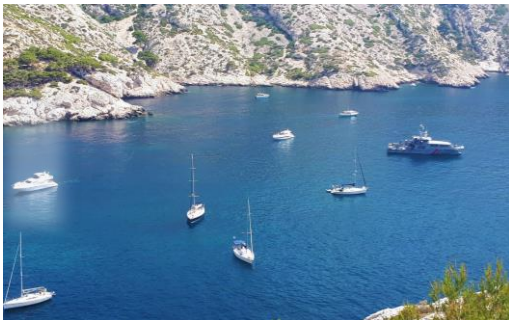
Calanque, En Vau

Au cœur des Calanques, havre protégé, à bord d'un bateau électrique hybride, dans le respect de la nature, votre guide vous racontera l'histoire du paysage, de sa faune et de sa flore.