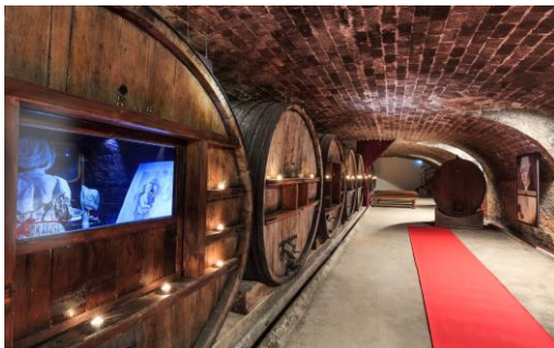
Château Saint Martin

Un voyage interactif et ludique, qui vous plongera dans une aventure sensorielle pour vivre au cœur d'un domaine où se marient production de vins et de spiritueux.