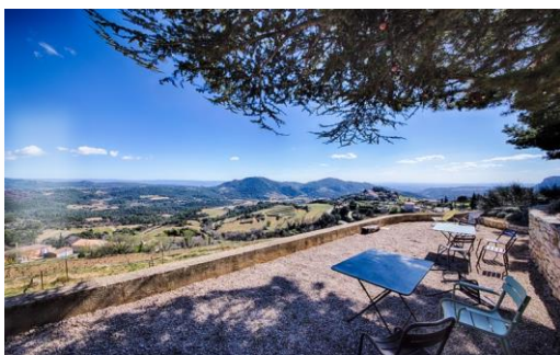
Domaine de la Ferme Saint-Martin

L'assemblage est l'art de composer un vin à partir de différents cépages.