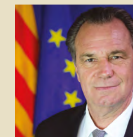
Renaud MUSELIER Président de la Région Provence-Alpes-Côte d'Azur Président délégué de Régions de France