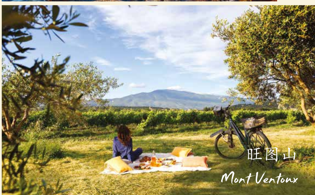
旺图山 Mont Ventoux