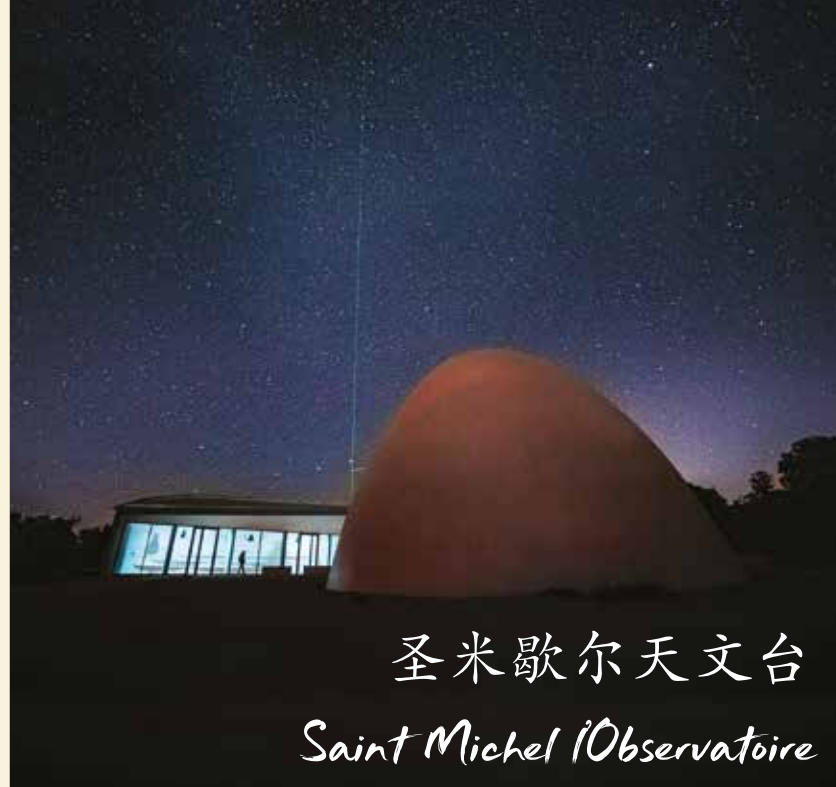
圣米歇尔天文台 Saint Michel l'Observatoire