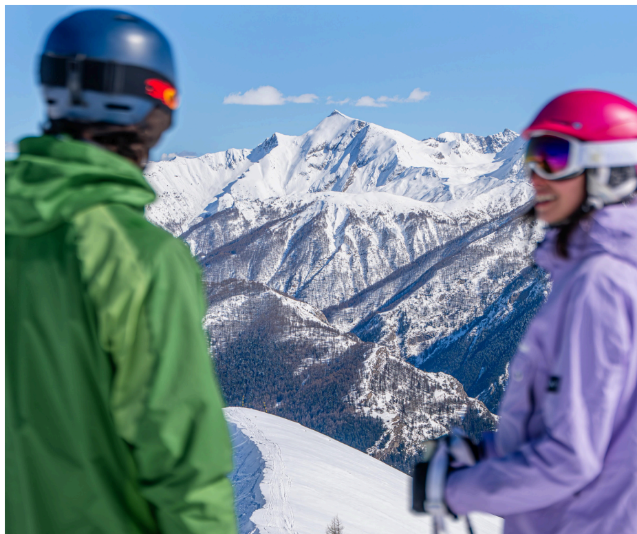
Bluemax Media-Panorama Pra Loup