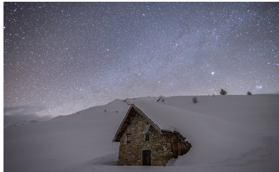
Bivouac à la Cabane de Faravel Parc National des Ecrins