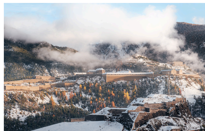
Fort des têtes - Serre-Chevalier Briançon