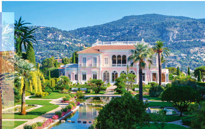
Villa Ephrussi de Rothschild - Saint-Jean-Cap-Ferrat