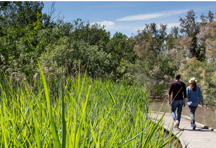
Marais du Vigueirat / Marais du Vigueirat Nature Reserve