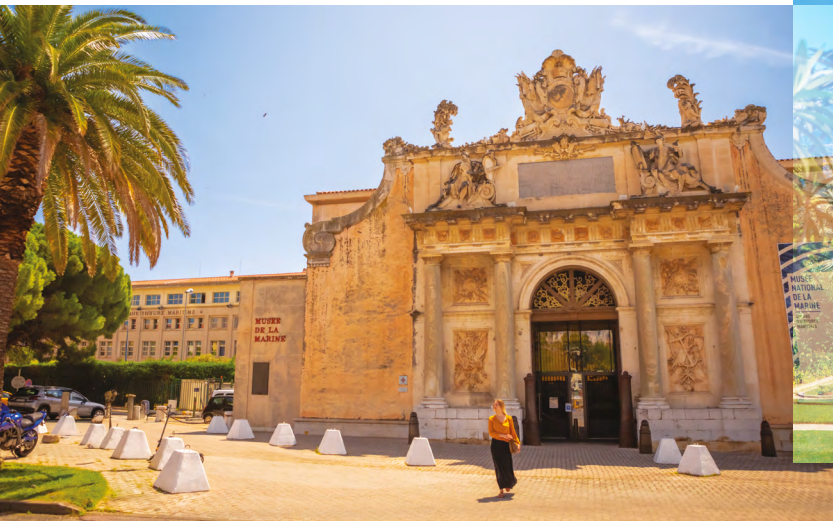
Musée national de la Marine - Toulon / National Naval Museum - Toulon