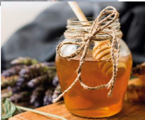
CRTL Occitanie / Hervé Leclair Algodia