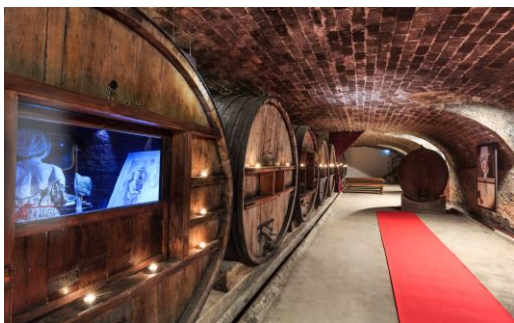
Château Saint Martin

Un voyage interactif et ludique, qui vous plongera dans une aventure sensorielle pour vivre au cœur d'un domaine où se marient production de vins et de spiritueux.